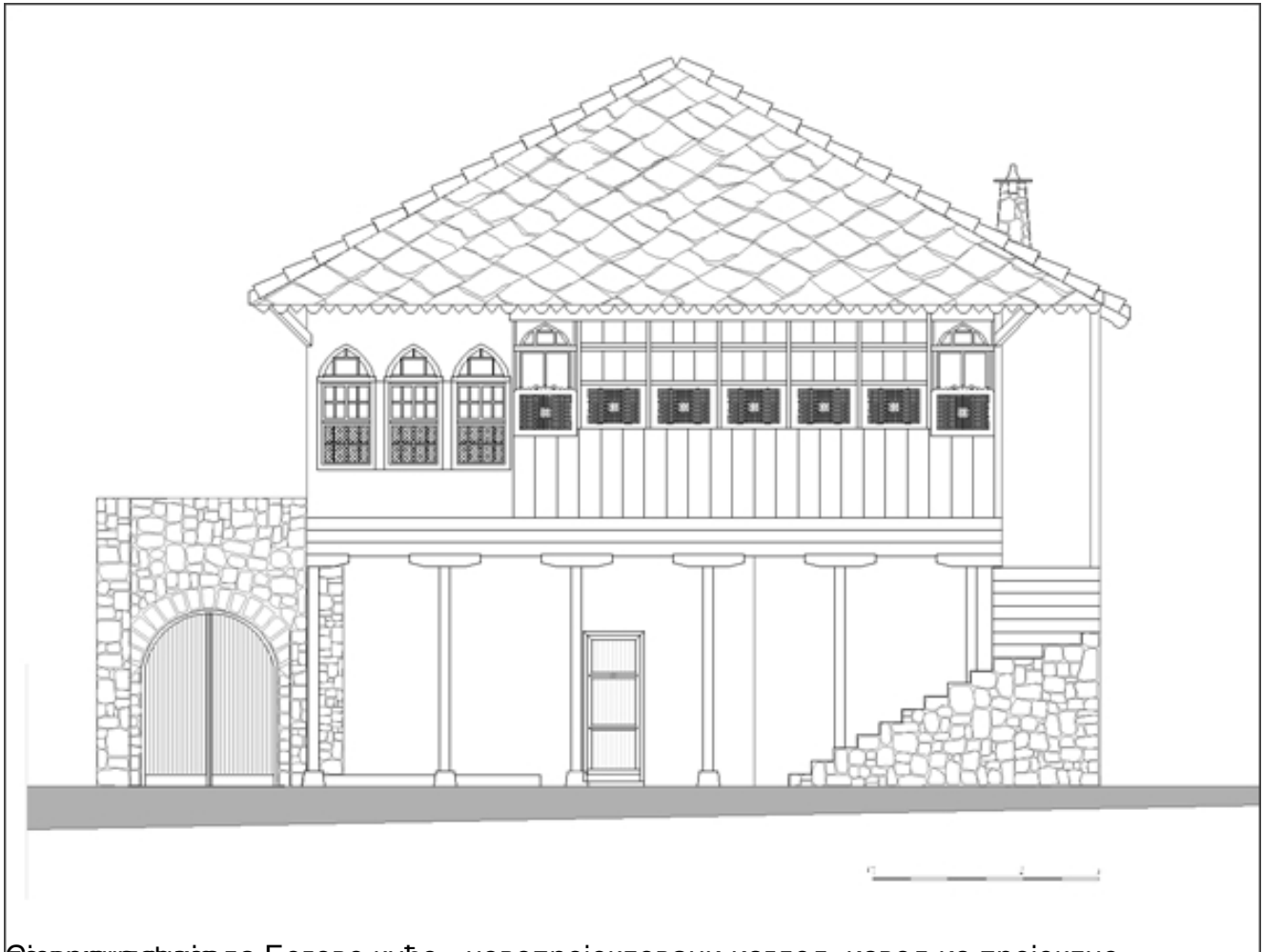
Источна фасада Бегове куће - новопроектовани изглед, извод из пројектне документације