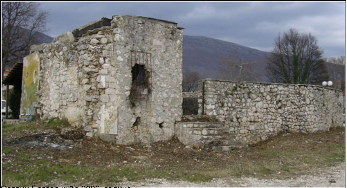
Остаци Бегове куће 2006. године