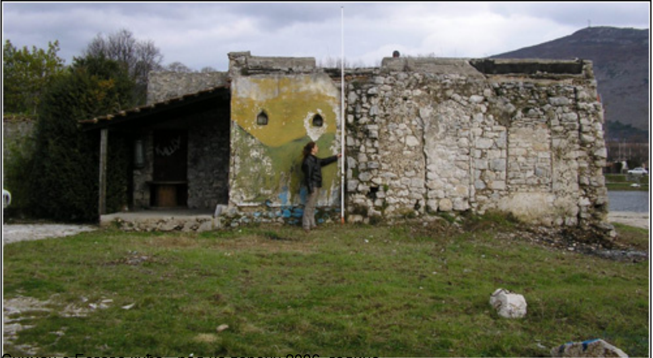
Снимање Бегове куће - рад на терену 2006. године