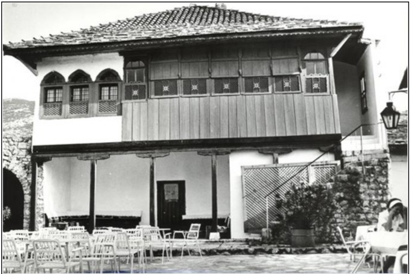
Аутентични изглед Бегове куће у Требињу

Мјесто и остаци градитељске цјелине Ресулбеговића куће уврштени су на Листу националних споменика Босне и Херцеговине јула 2006. године.