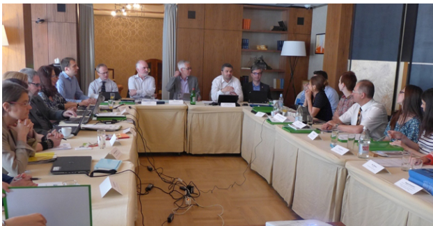
фотографија 4 - састанак ENCA мреже у Београду

Основна тема састанка била је политика Европске уније у области обновљивих извора енергије и заштите природе са примјерима националних политика у овој области. Организован је и IUCN Workshop о систему заштите природе и управљању заштићеним подручјима у земљама ЕУ те скуп под називом “Заштита природе у Европи Данас: од финских тресетишта до медитеранских лагуна“ у организацији Међународне уније за заштиту природе (IUCN) и Завода за заштиту природе Србије. У оквиру састанка званичници институција за заштиту природе из Европе имали су прилику и да посјете Специјални резерват природе „Засавица“.