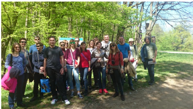
фотографија 3 - теренски дио у заштићеном подручју Парк Тиволи у Љубљани

Партнер на пројекту испред Републике Српске је Републички завод за заштиту културно-историјског и природног наслеђа. Свеукупни циљ овог пројекта је да ојача провођење стандарда очувања у југоисточној Европи, кроз подршку институционалном развоју и креирању регионалне платформе за планирање очувања природе. Програм у Словенији се састојао из теоретског дијела који је одржан у централни Завода у Љубљани, те теренског дијела у Љубљани и Новом Месту.