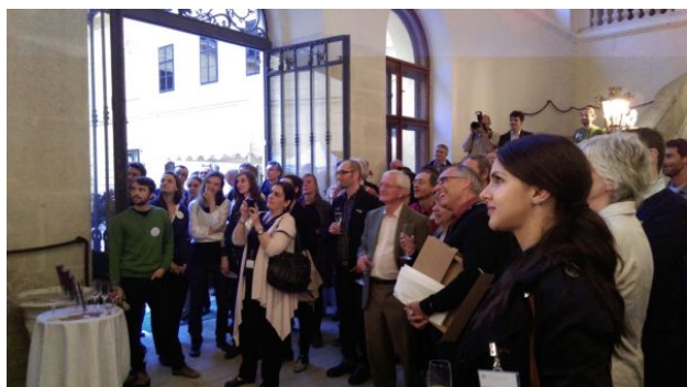
фотографија 2 - током предавања у аустријском Хајнбургу

Ова конференција је организована са циљем да се приближе резултати и закључци са Свјетског конгреса паркова који је одржан у аустралијском Сиднеју 2014. године, са нагласком на теме од посебног интереса за Европу.