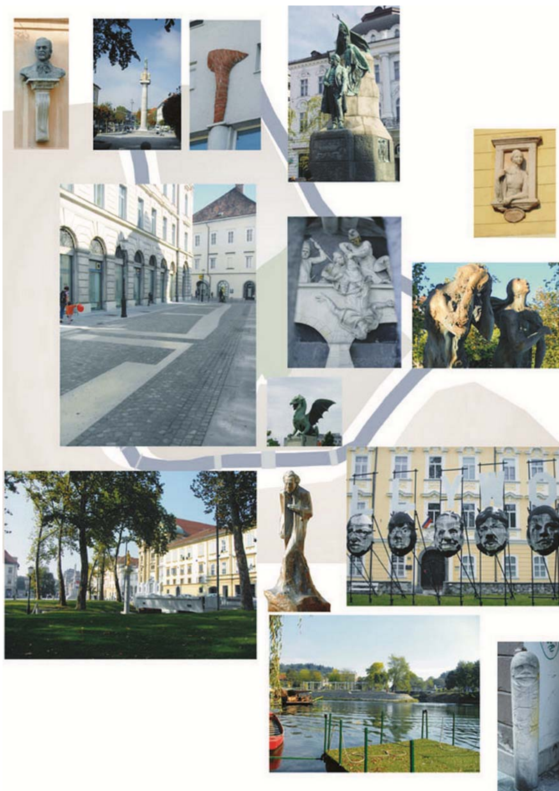
Слика 2. – Ликовна дјела и археолошка налазишта