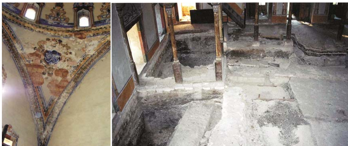
СЛИКЕ 1. и 2. – УНУТРАШЊОСТ ЏАМИЈЕ

Установљено је да је дебљина културног слоја у оквирима сале за молитву до 1,90–2,00 м од савременог нивоа. Стратиграфска анализа показала је следеће хронолошке фазе: касно гвоздено доба (IV–I век пре н. е.), касно античко доба (IV–VI век), грађевинске ископине које тешко могу да буду датиране само због начина зидања, материјали из XVI–XVIII века, од којих су интереснији дихрем султана Мурата III (1574–1595), кован 1574. године (982. по хиџри) у ковници Халеп (данашњи Алепо, Сирија); акче султана Мурата IV (1623–1640), коване 1623. године (1.032 по хиџри) у ковници Бурса; акче султана Селима I (1512–1520). Ове ископине пронађене су за време проучавања подног нивоа. 12 Сондаже пружају могућност да се јасније сагледа план старије зграде.