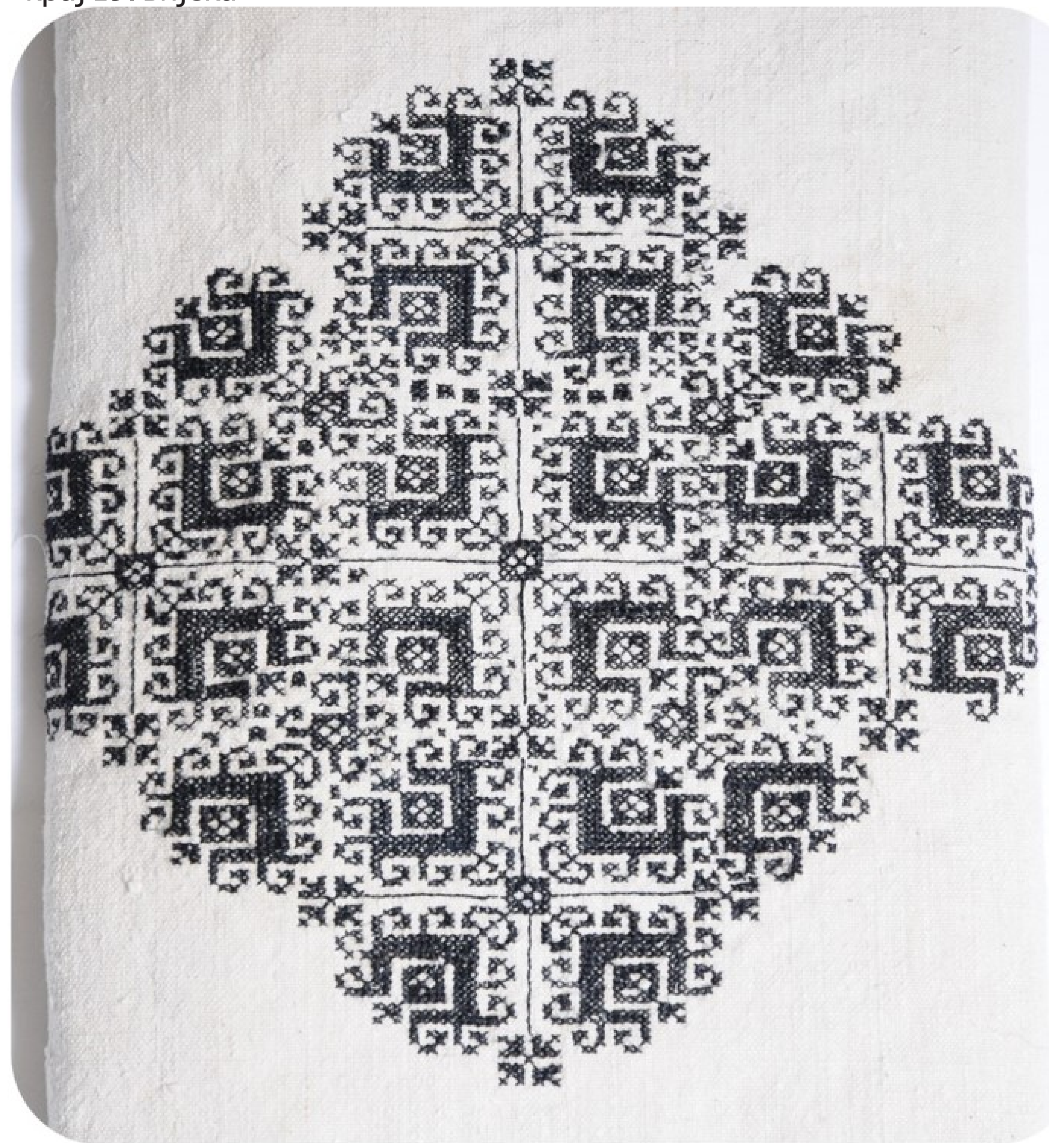
Zmijanje embroidery, "branch" ornament, showpieces of the Museum of Republic of Srpska, late XIX century

Змијањски вез, мотив "грана" експонат Музеја Републике Српске, крај 19. вијека