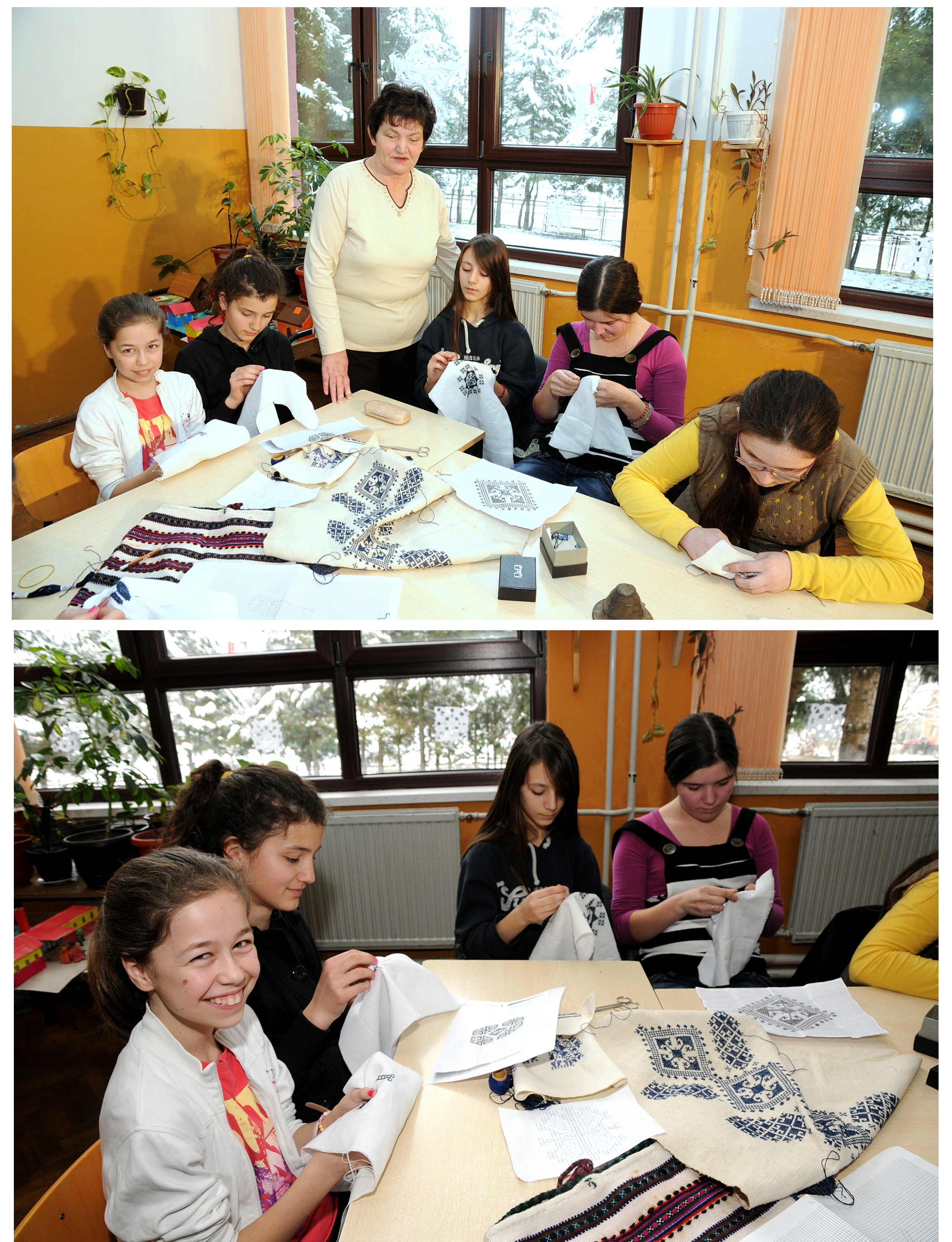
Zmijanje Embroidery Workshop with schoolchildren, 2013

Радионице Змијањског веза са дјецом, 2013. година