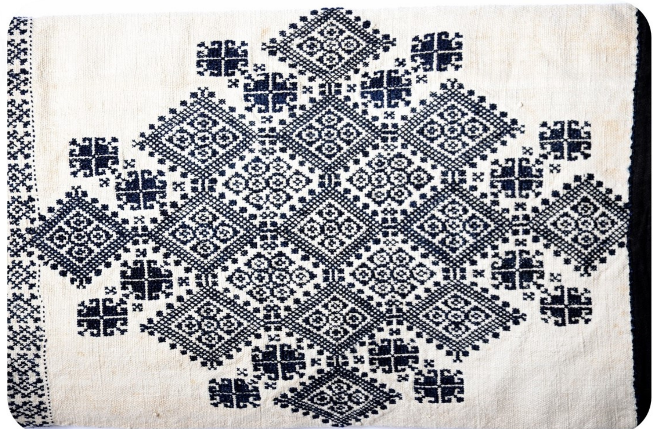
Zmijanje embroidery, "wheel" ornament, showpieces of the Museum of Republic of Srpska, late XIX century