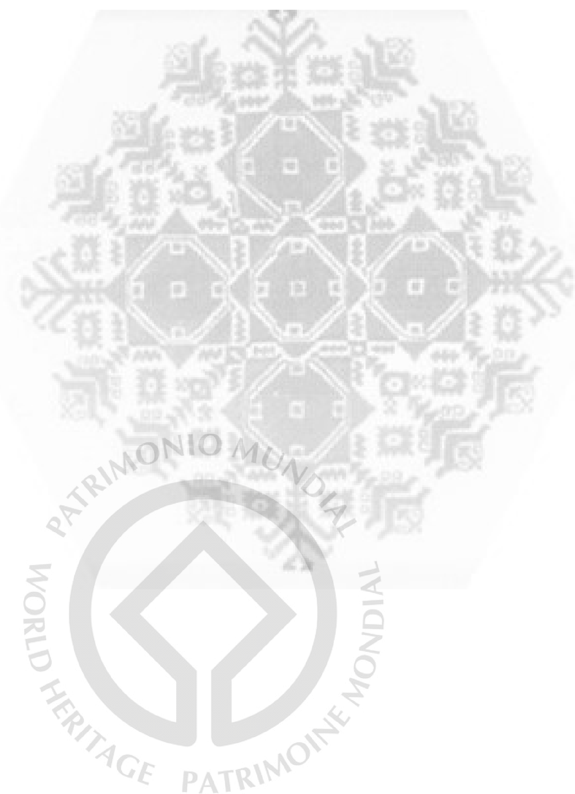
Змијањски вез, мотив "кола", експонат Музеја Републике Српске, Крај 19. Вијека